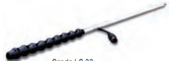
Sonde LS 33